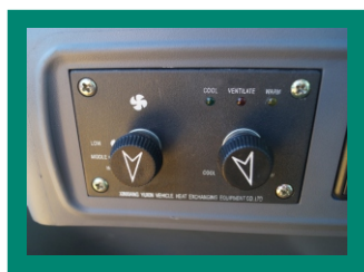
Система вентиляции и кондиционирования воздуха