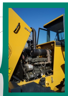
Экономичный дизель водяного охлаждения