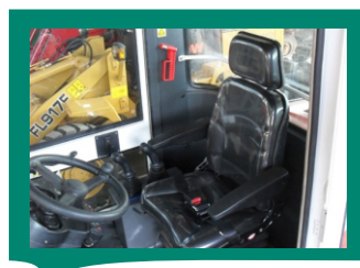
Безопасное и эргономичное сидение оператора