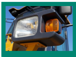
Блок фар выполнен в оригинальном дизайне