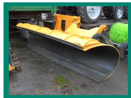
отвал коммунальный скоростной