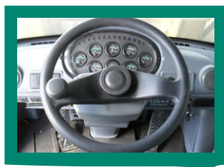
Простая и информативная панель приборов